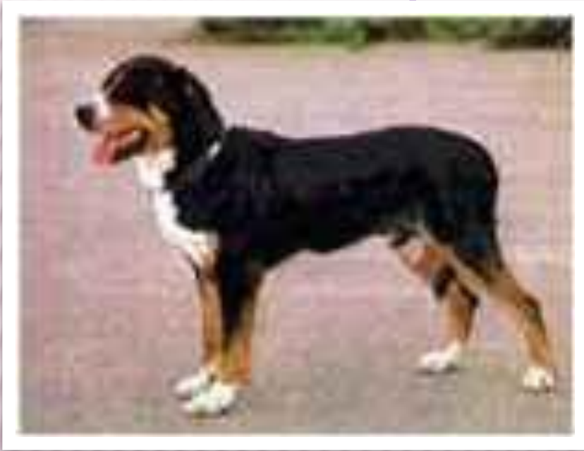
БОЛЬШАЯ ШВЕЙЦАРСКАЯ ОВЧАРКА

Веками, отбирая собак, человек вывел около четырехсот пород, отличающихся друг от друга размерами, формами и возможностями.