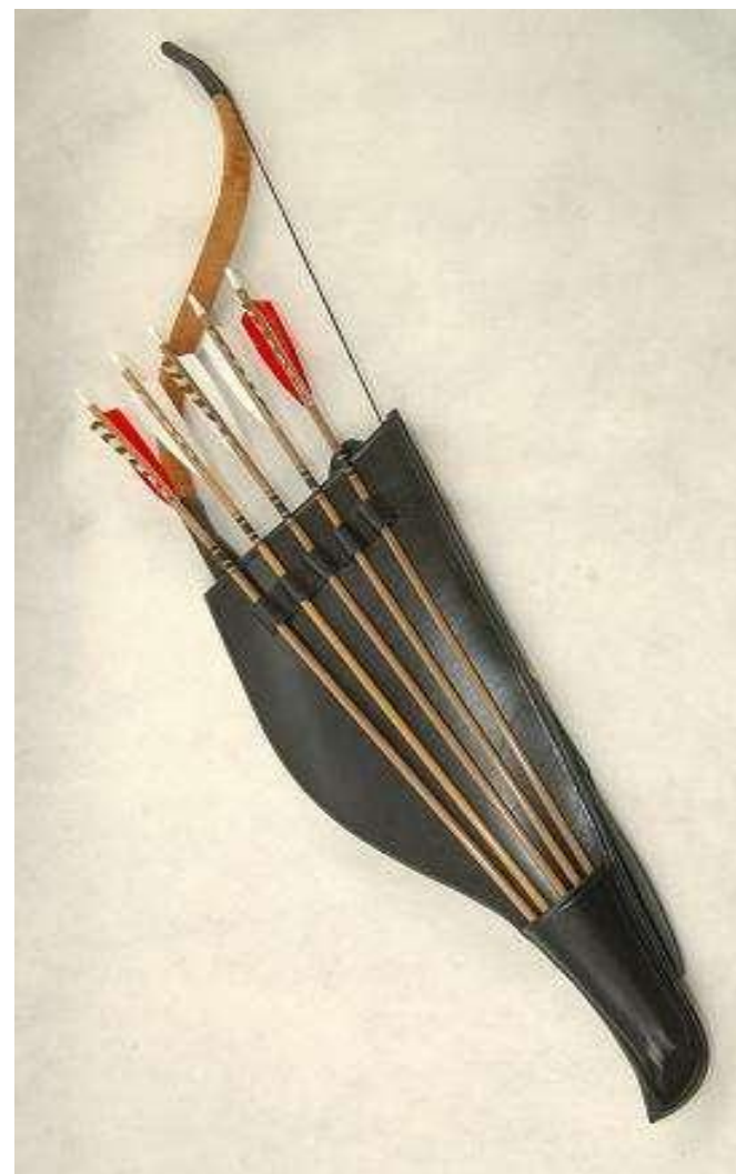
На поясе носили лук и колчан со стрелами