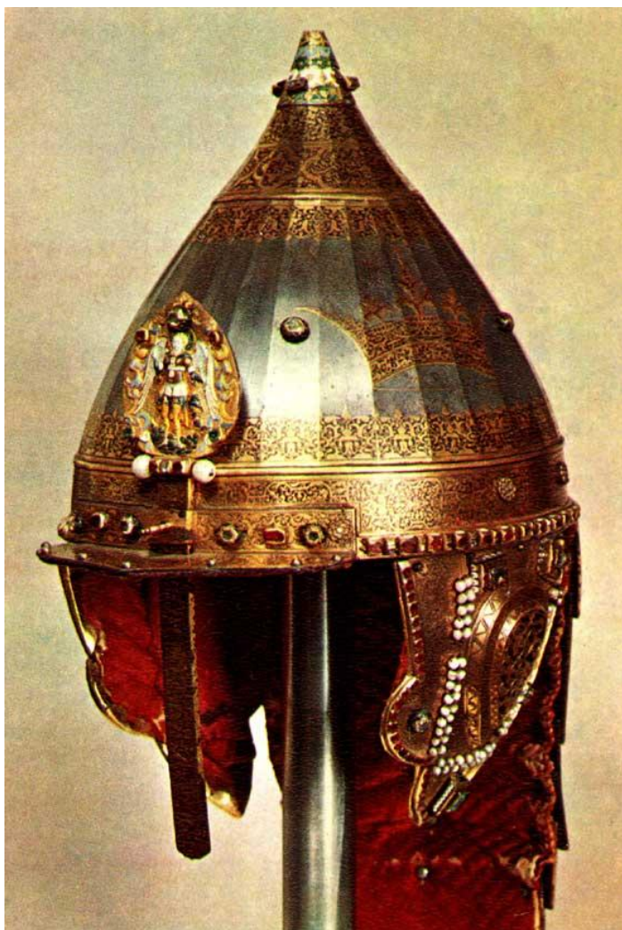
На голову надевали шлем колчан со стрелами