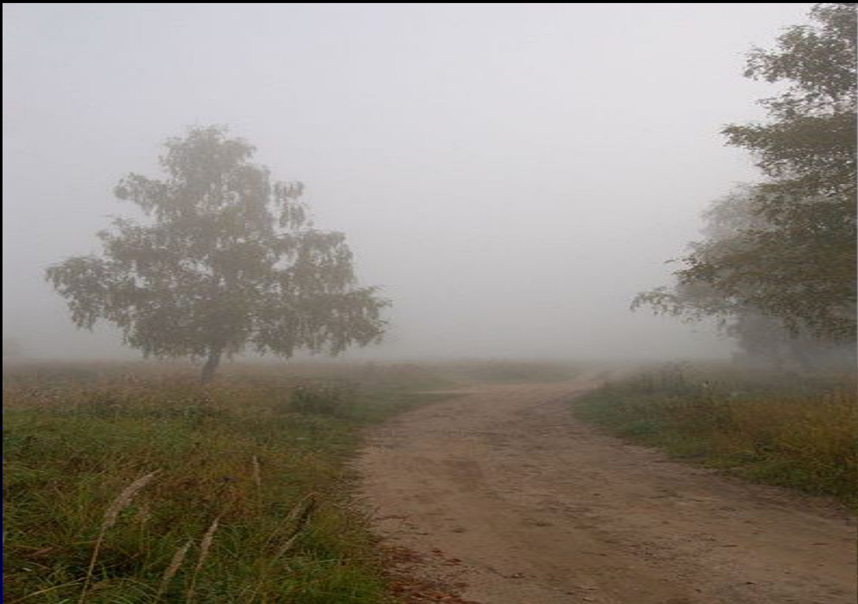
Просёлочная дорога в тумане (Подмосковье, Наро-Фоминск).