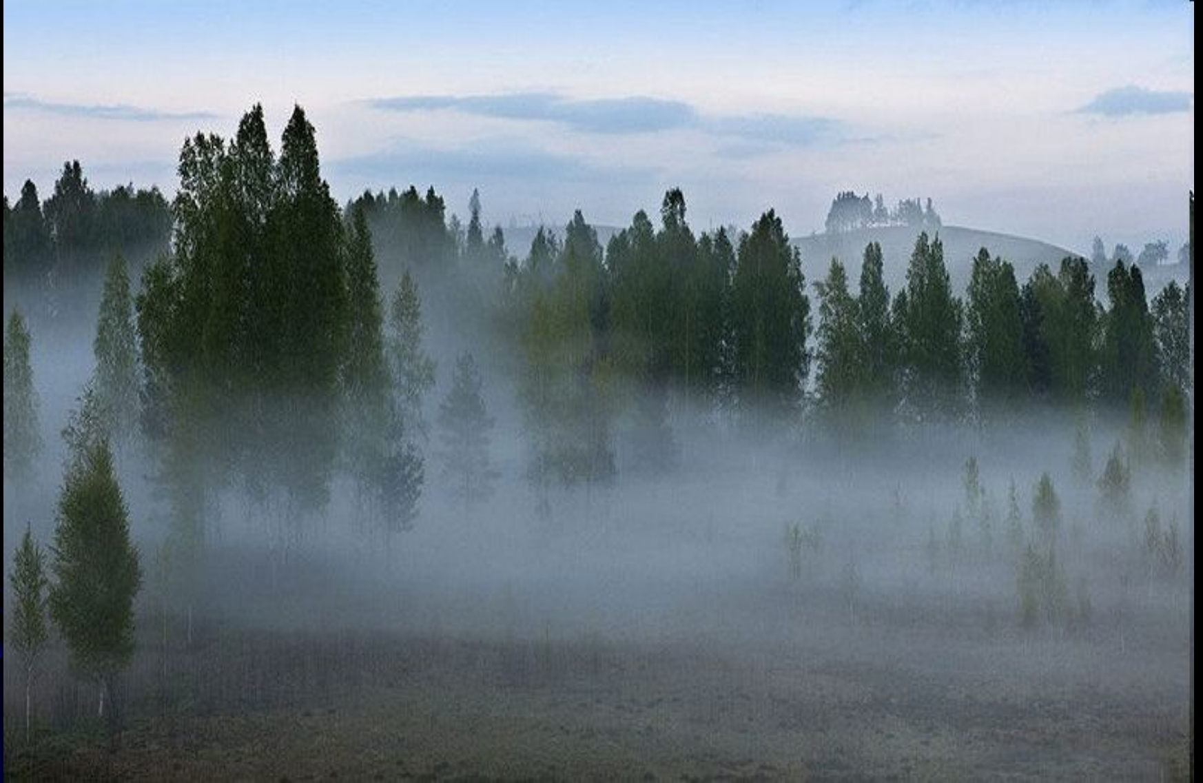
Туман в Изборской Долине (Псковская область).