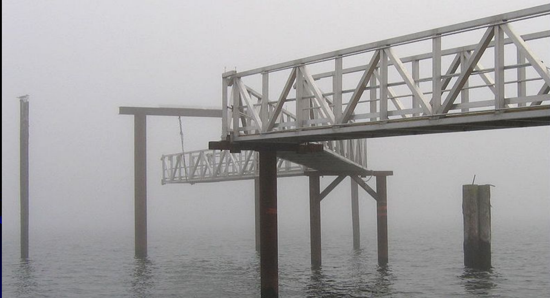
Пирс в тумане. Остров Ванкувер, город Сидней.