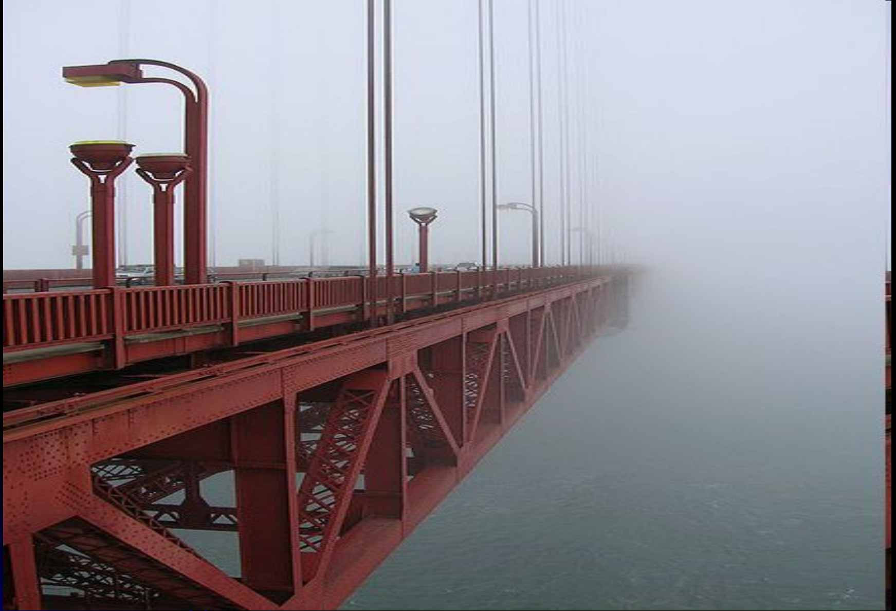
Знаменитый туман Сан-Франциско (Золотые ворота).