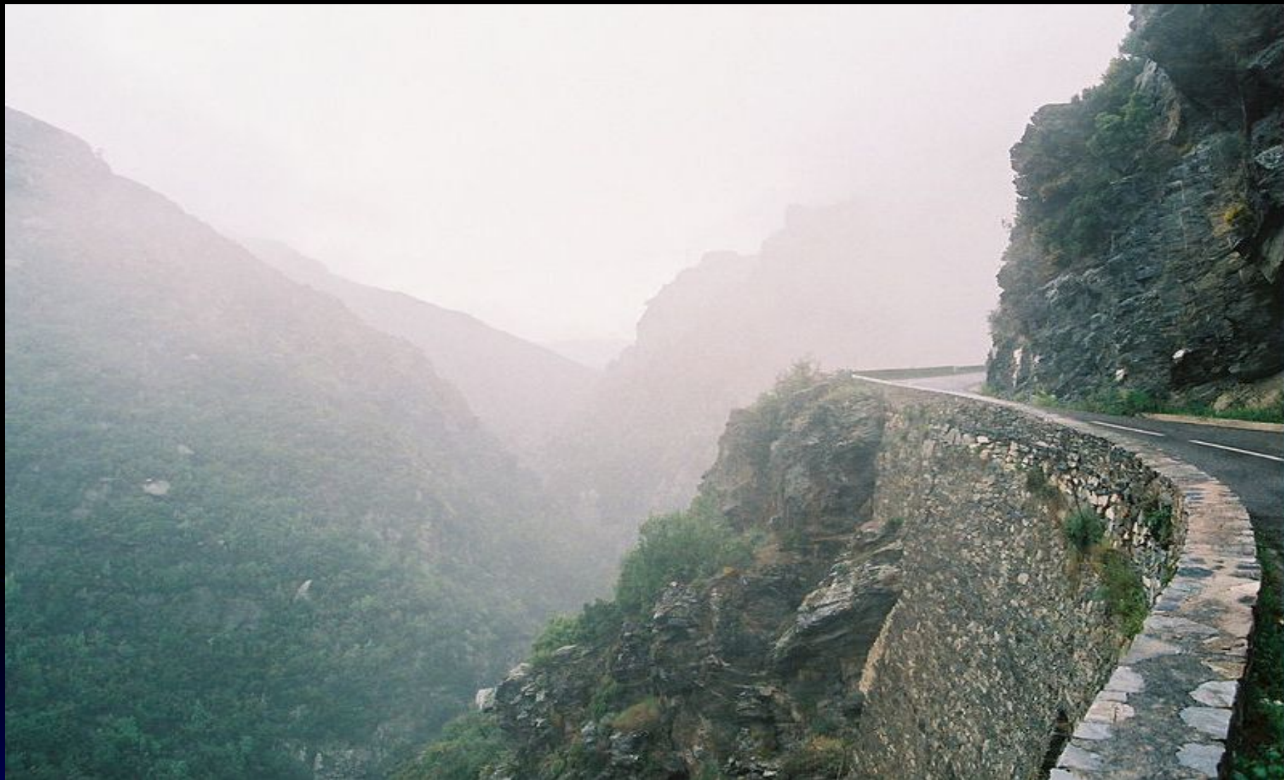
Горная дорога в тумане (шоссе D81 на Корсике).