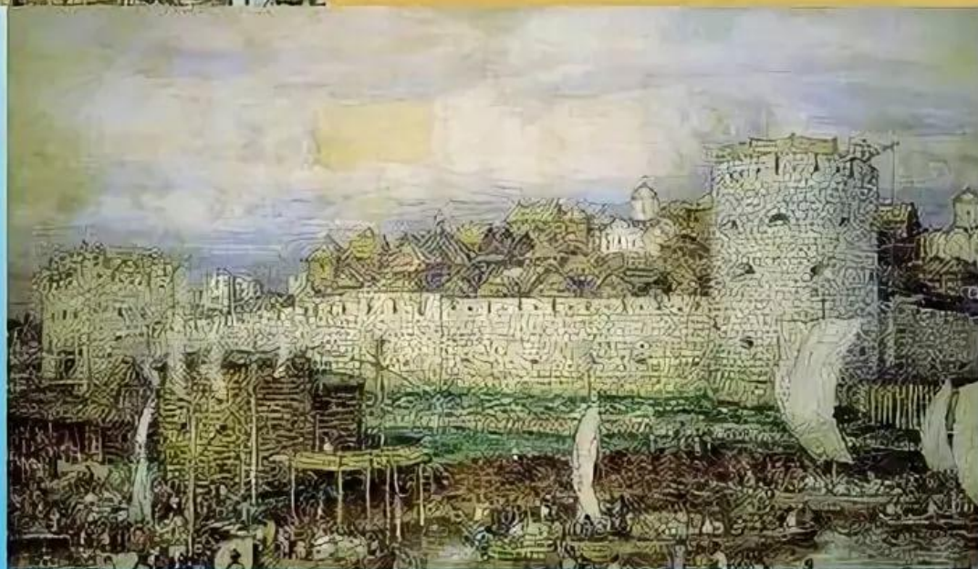
Белокаменный Московский Кремль при Дмитрии Донском

И только в конце 14 века деревянные стены заменили белокаменными .