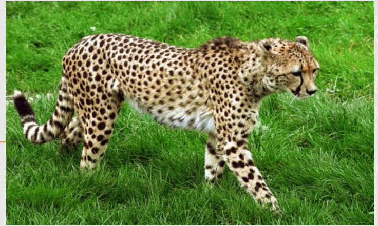
Гепард- больше 100