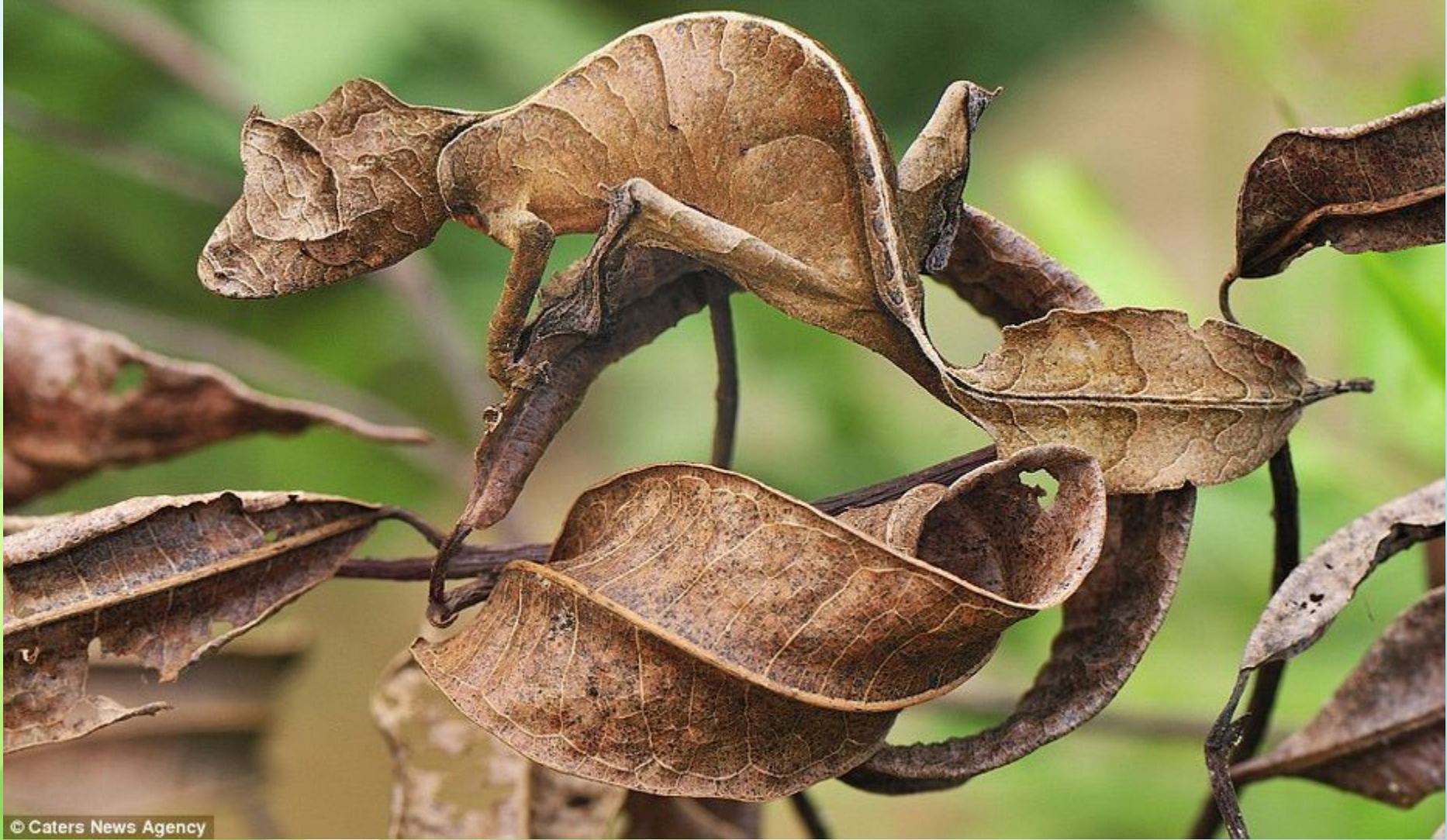
Листохвостый или сатанинский геккон (ящерица).