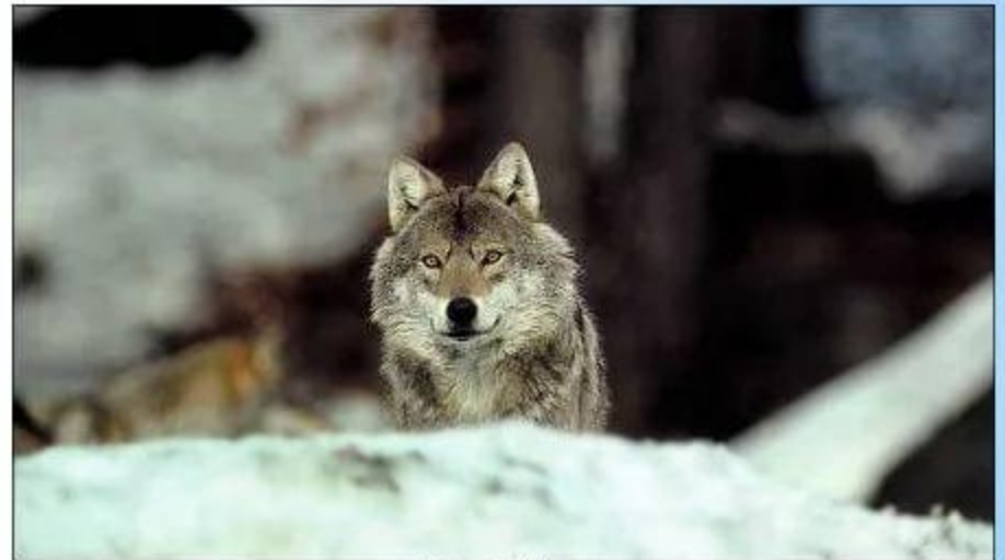
Волк – Canis lupus