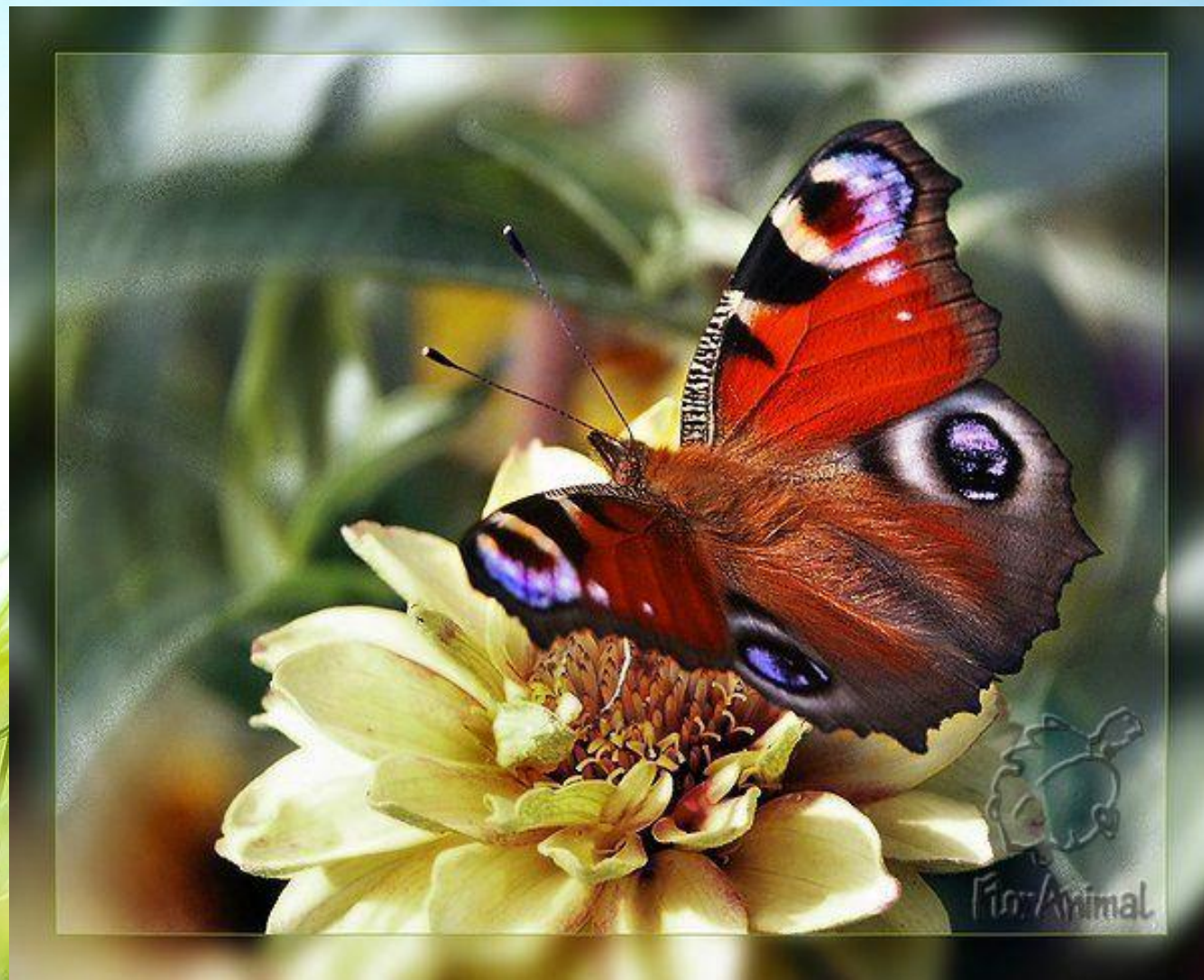
Бабочка павлиний глаз