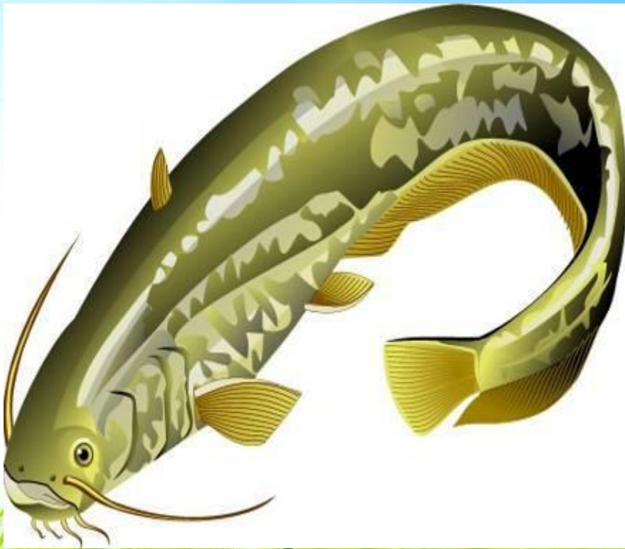
с о м