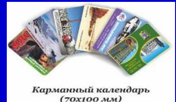
Карманный календарь (70x100 мм)