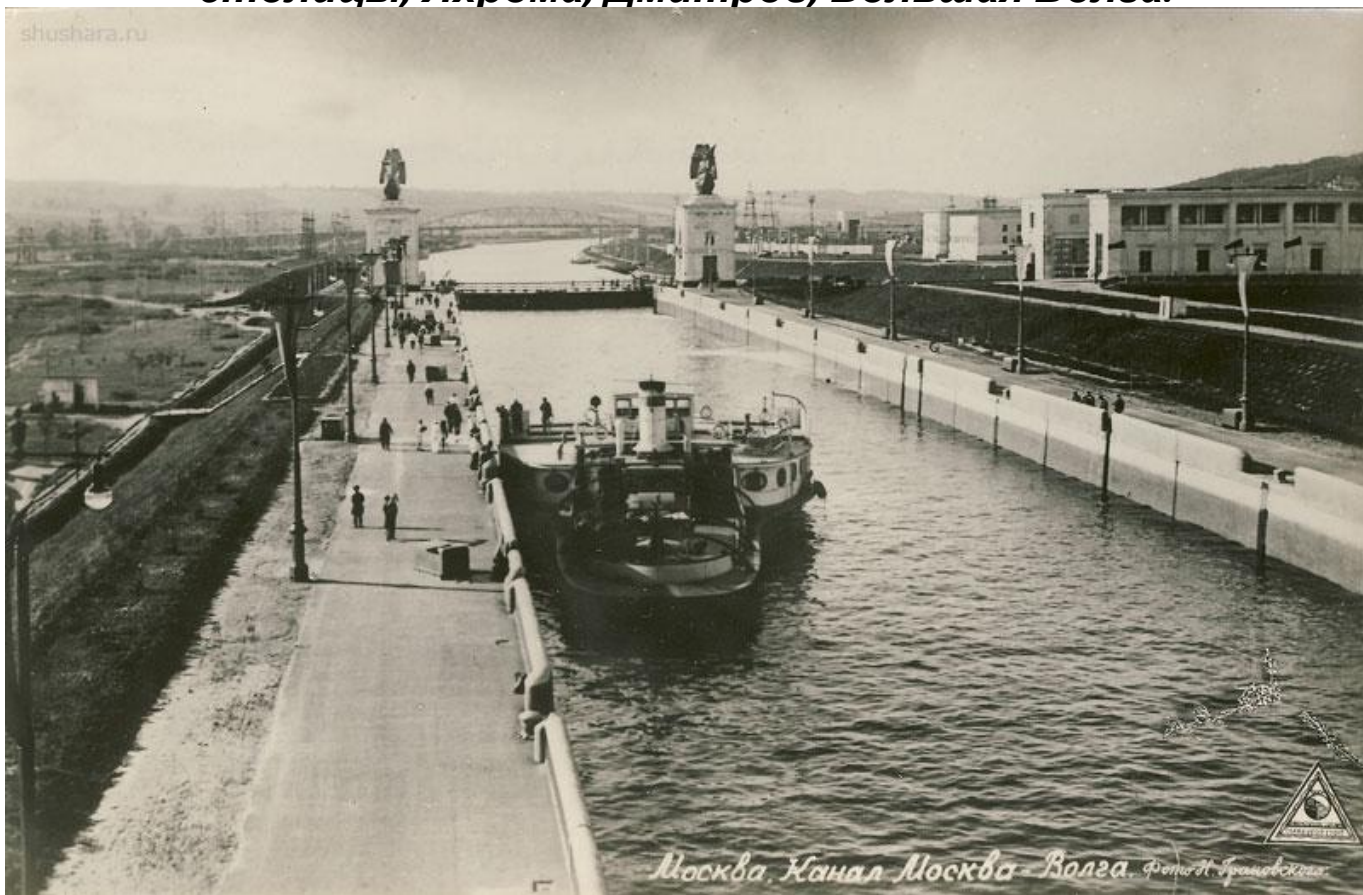
Москва. Канал Москва-Волга.

Общая длина канала — 128 км. Начинается канал от Иваньковского водохранилища (близ города Дубны), где находятся шлюз и Иваньковская ГЭС, соединяется с Москвой-рекой в районе Щукино города Москвы. Канал снабжает Москву водой, служит для обводнения реки Москвы (ежегодно в реку из Волги поступает 1,8 км 3 воды), обеспечивает подачу электроэнергии на многие предприятия Московской области (всего на канале 8 ГЭС), создаёт кратчайшую транспортную связь Москвы с Верхней Волгой; благодаря системе каналов (Беломорканал, Волго-Дон) за столицей закрепилось название «порта пяти морей» — Белого, Балтийского, Каспийского, Азовского и Чёрного. Крупнейшие грузовые пристани — Северный речной порт столицы, Яхрома, Дмитров, Большая Волга.