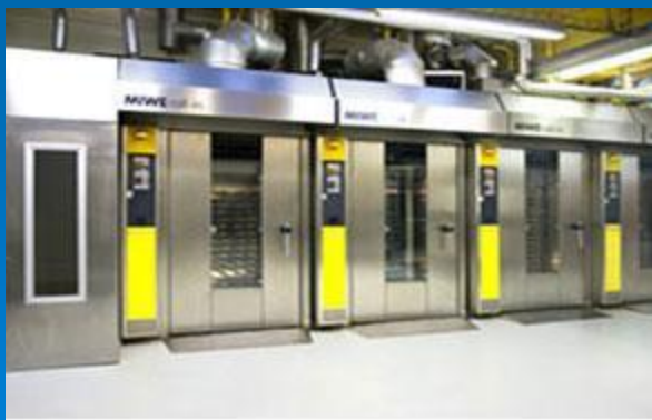
Новая линия по производству батонов