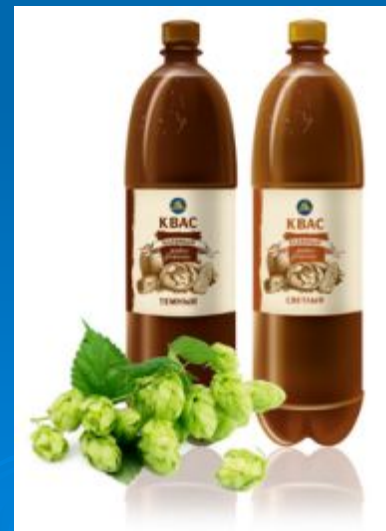
Живой квас от «КАРАВАЯ»