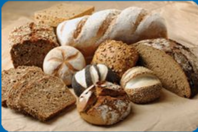
Хлеба и батоны