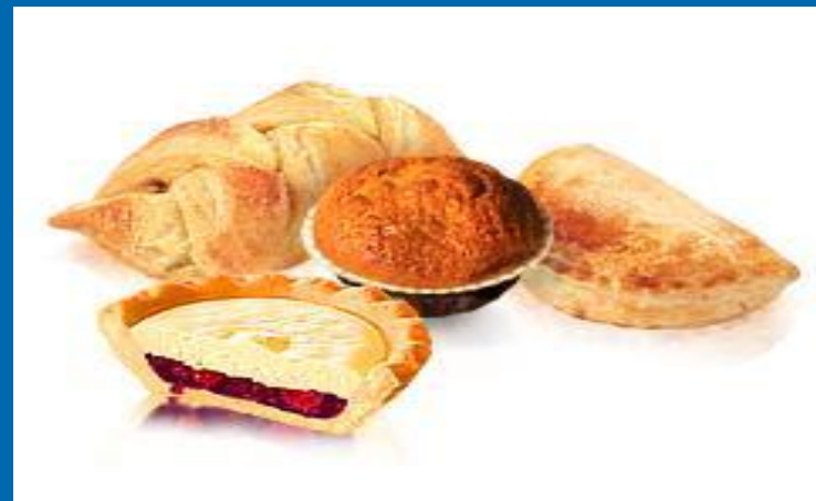
Сдоба, слоёные и кондитерские изделия