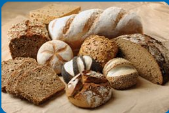
Хлеба и батоны