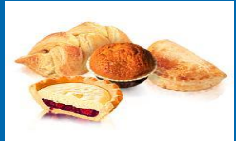
Сдоба, слоёные и кондитерские изделия