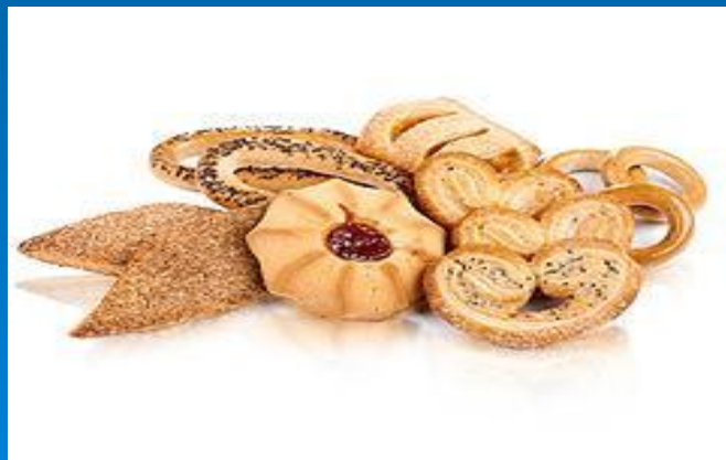
Продукция длительного срока хранения