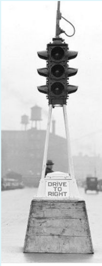
Один из первых электрических светофоров