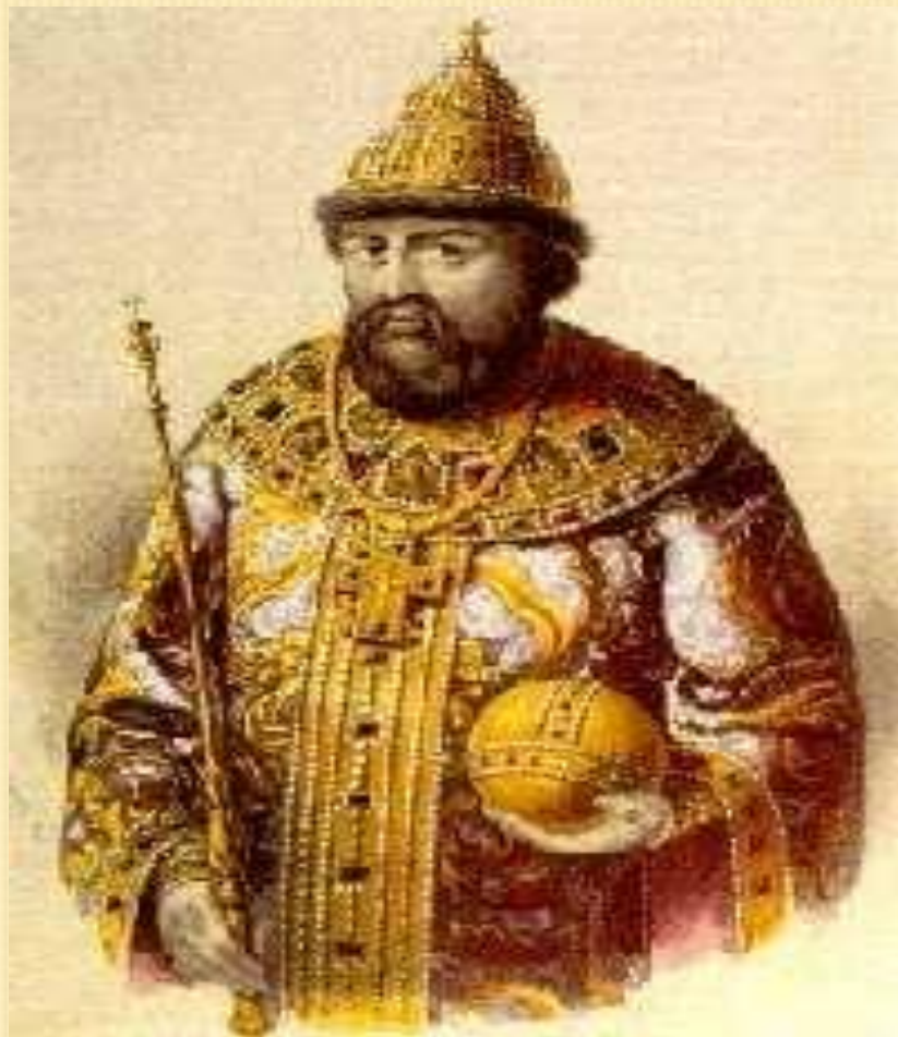
Русский посол Василий Старков.