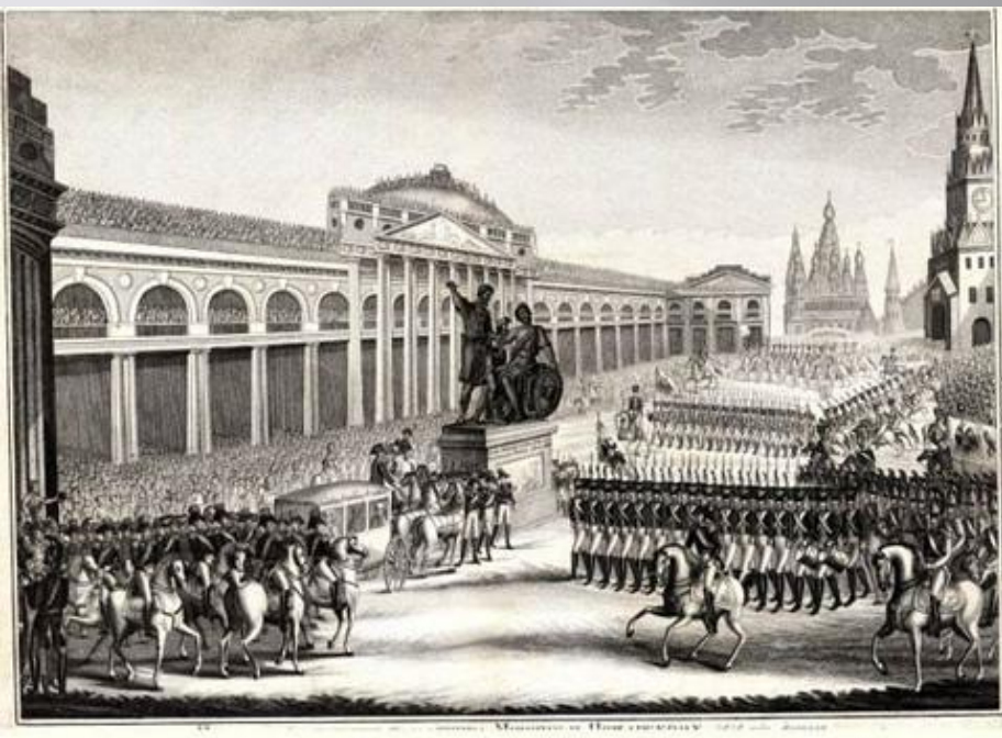
Открытие памятника Минину и Пожарскому