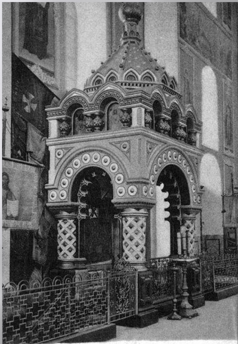
Гробница К.Минина в Михайлово-Архангельском соборе (г. Нижний Новгород)