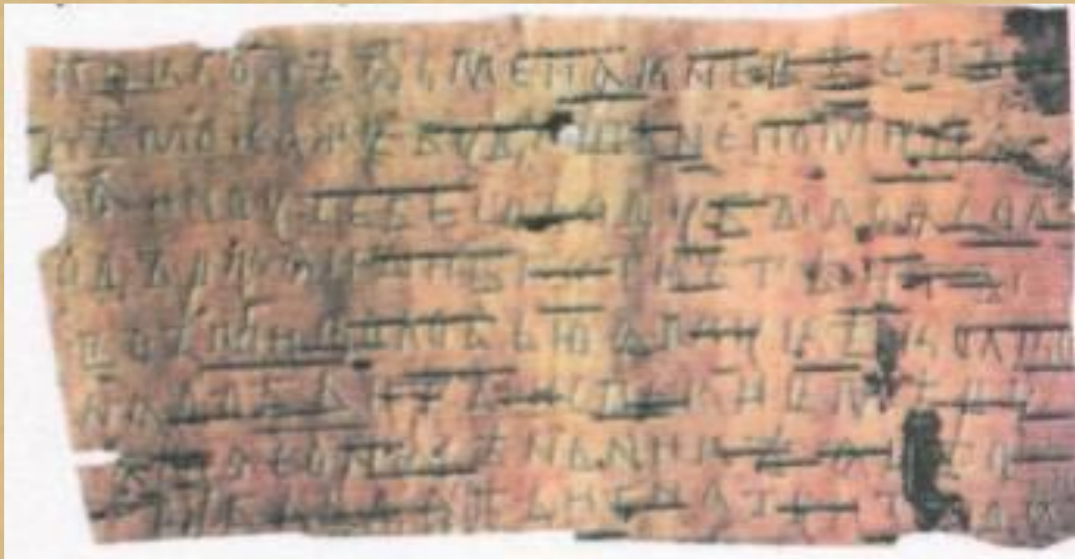
Берестяная грамота. XIV век.

В Древней Руси писали на березовой коре – БЕРЕСТЕ. Знаки на кору наносили костяным стерженьком с ушком вверху, сквозь которую продергивалась тесемка. Стерженёк подвешивали к поясу.