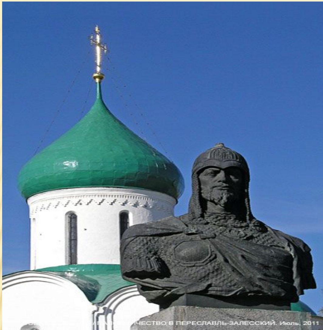
Памятник Александру Невскому в городе Переяславль - Залесский