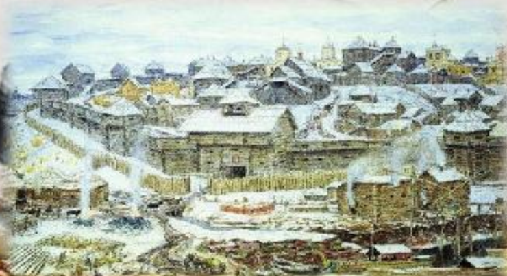
дубовый Московский Кремль