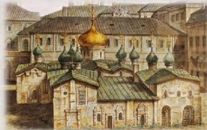
Собор спаса на бору