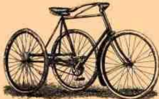
8. Трёхколёсный В.