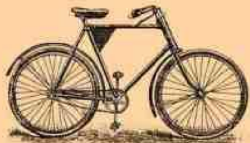
1. Массовый В.