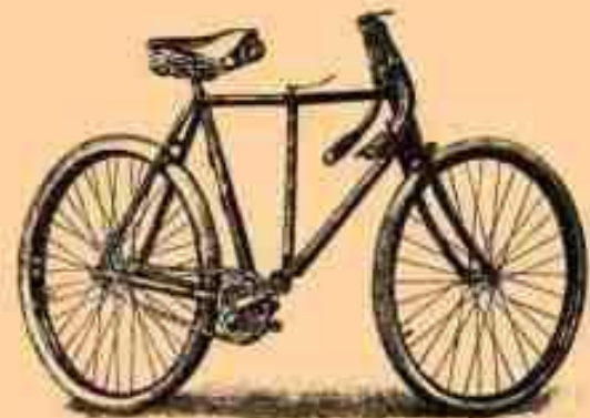
3. Бонный (обыкновенный) В.