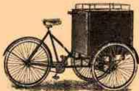
5. Трёхколёсный для перевозки груза.