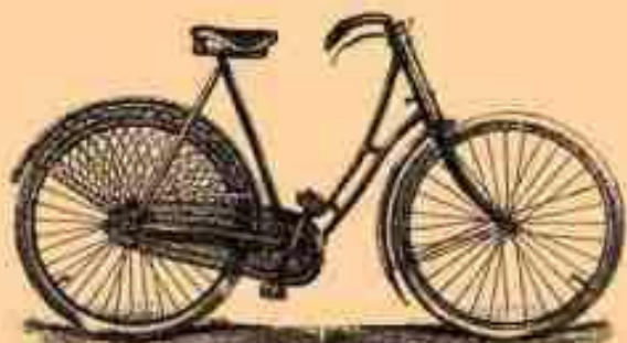
2. Данди В.