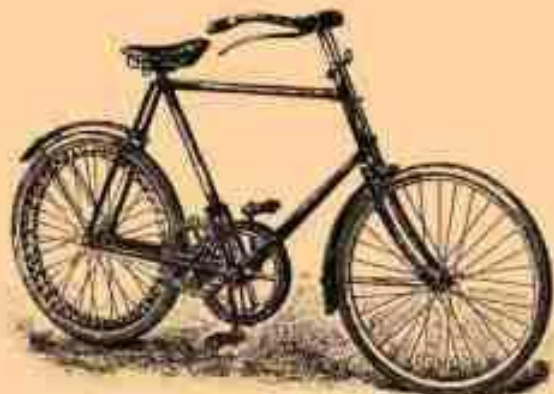
4. В. сь зубчатой передачей.