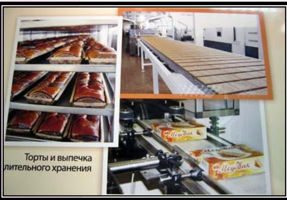
Торты и выпечка длительного хранения