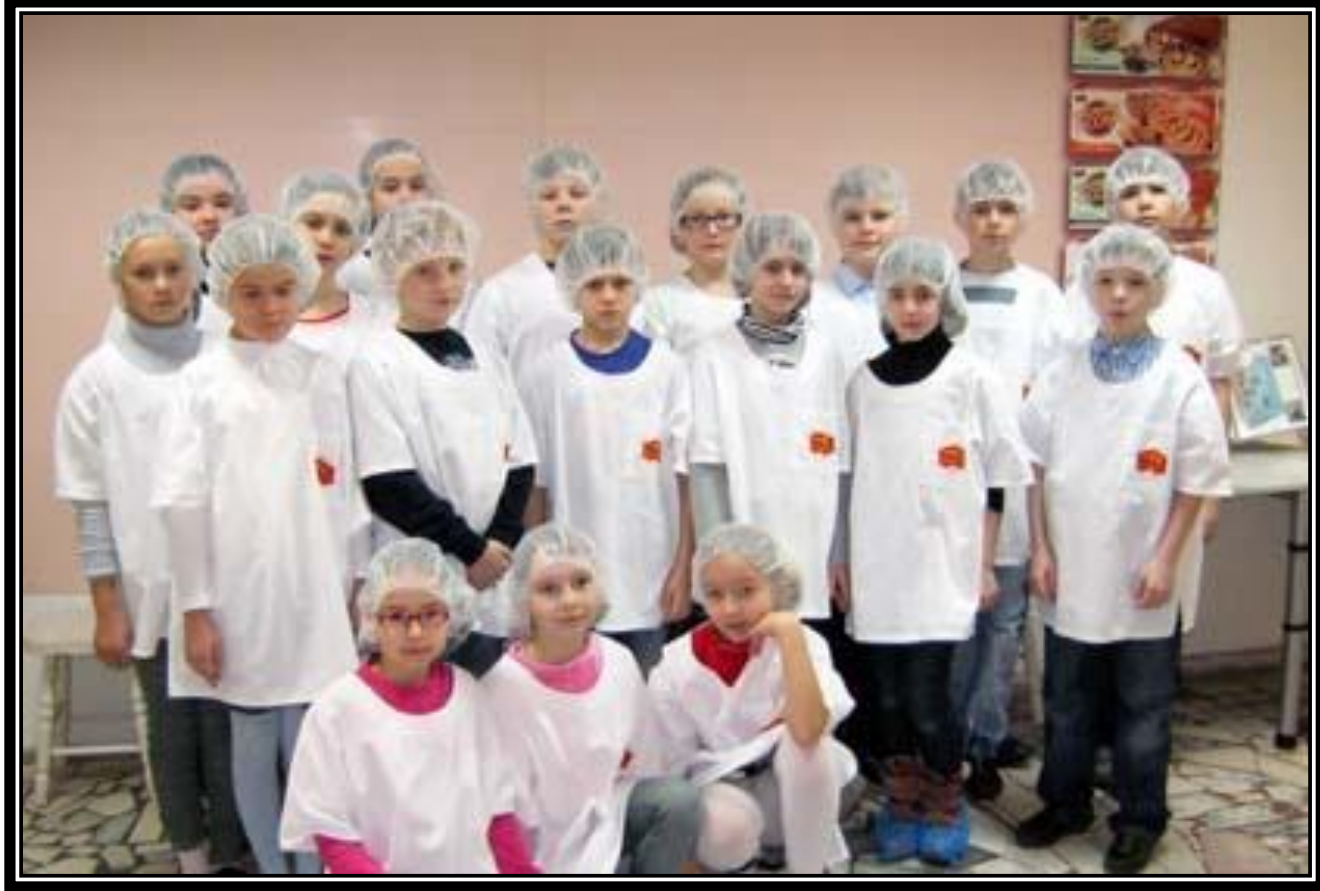
Команда стажёров 4