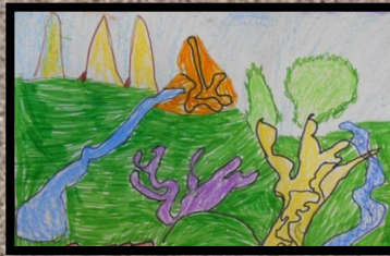
Рисунок Хасен Сабины «Природа будущего»