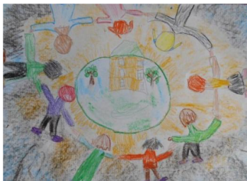
Рисунок Кулюпановой Насти для выставки детских работ «Край родной, навек любимый, не найти другой такой!»

Рисунок Саенко Насти для выставки детских работ «Наш Дом- Планета Земля!»