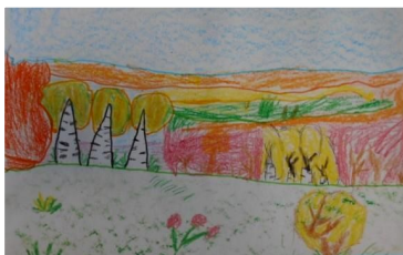
Рисунок Ляшенко Алёши на тему «Октябрьский район- журавлиный край!»

Рисунок Кулюпановой Насти для выставки детских работ «Край родной, навек любимый, не найти другой такой!»