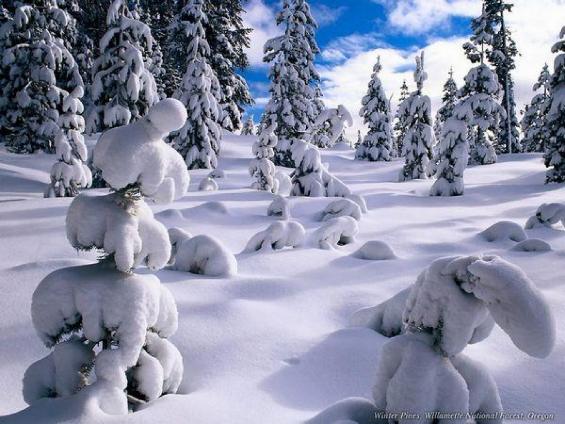
Winter Pines, Willamette National Forest, Oregon