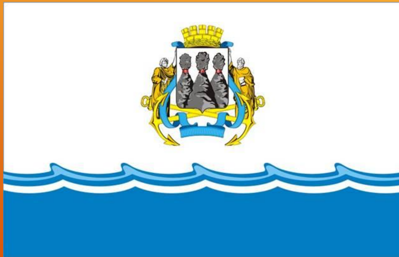
Флаг г. Петропавловска- Камчатского