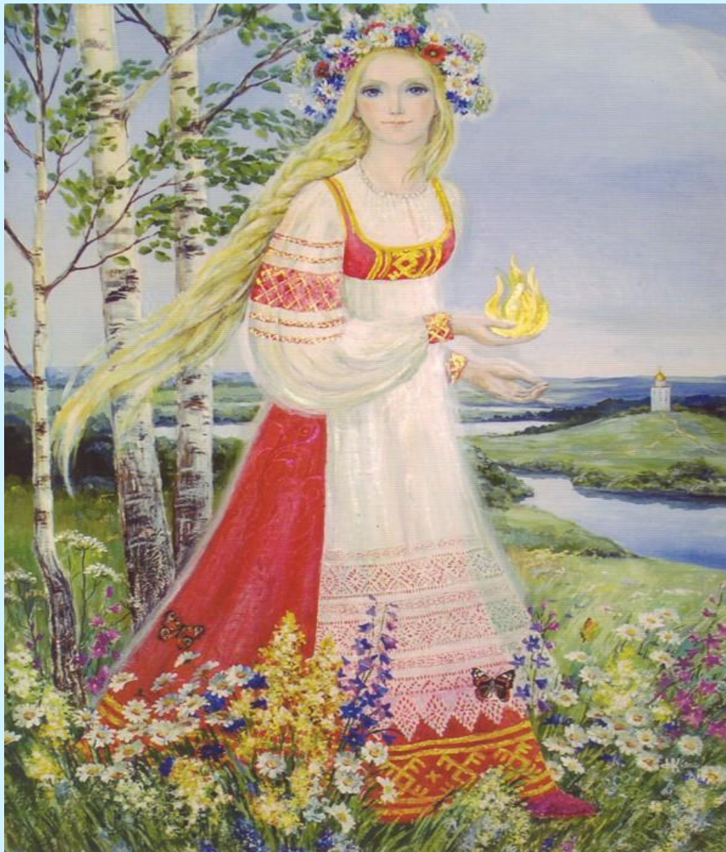
BECHA - КРАСНА