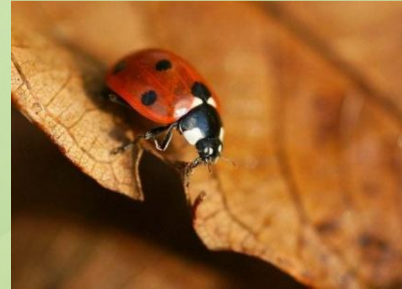
Помогают сгнить листве осенью