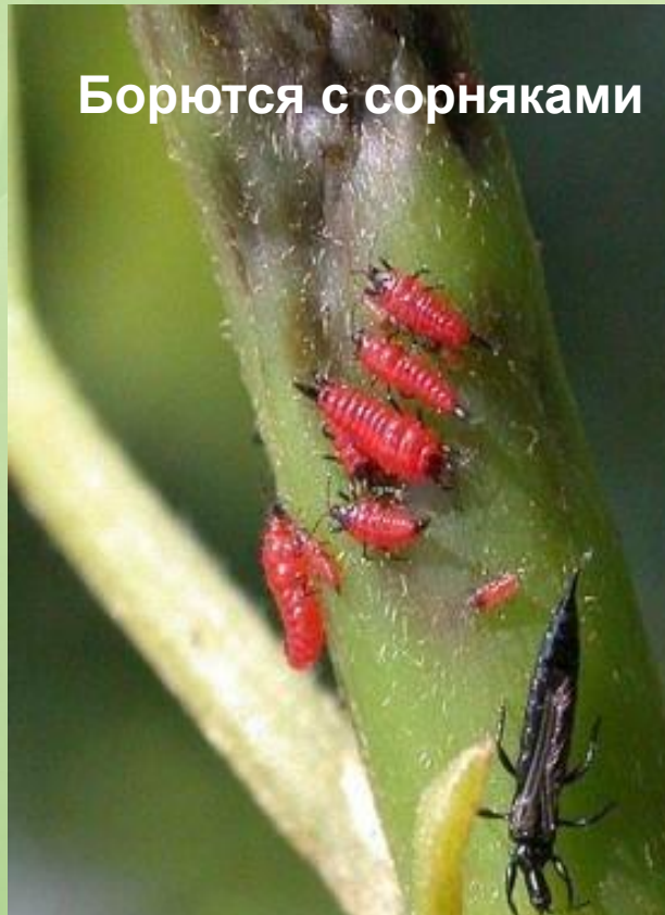
Борются с сорняками