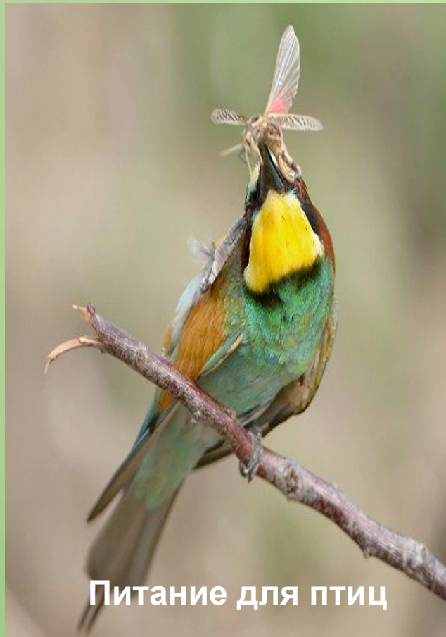
Питание для птиц