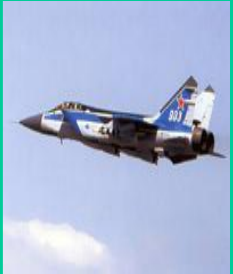
самолёт - истребитель