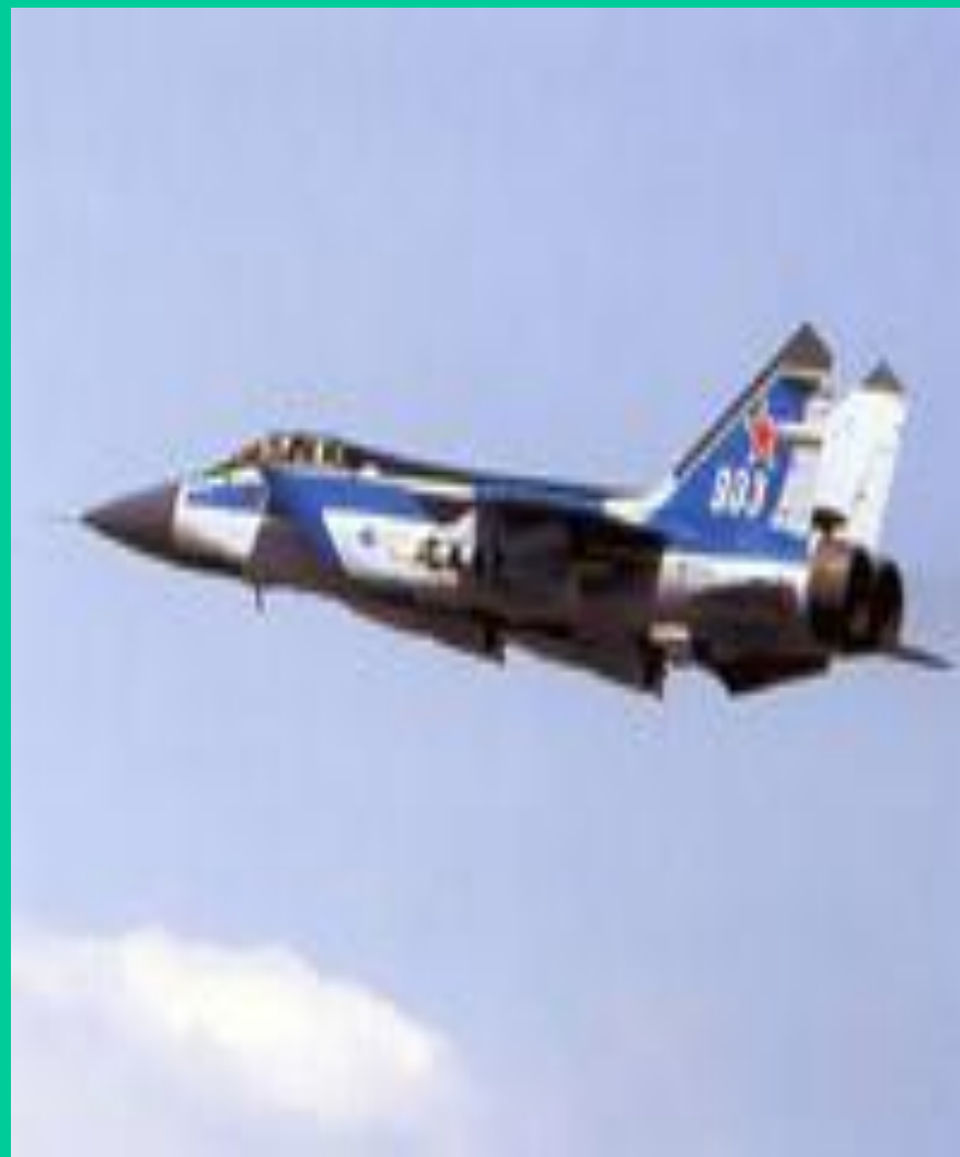
самолёт - истребитель