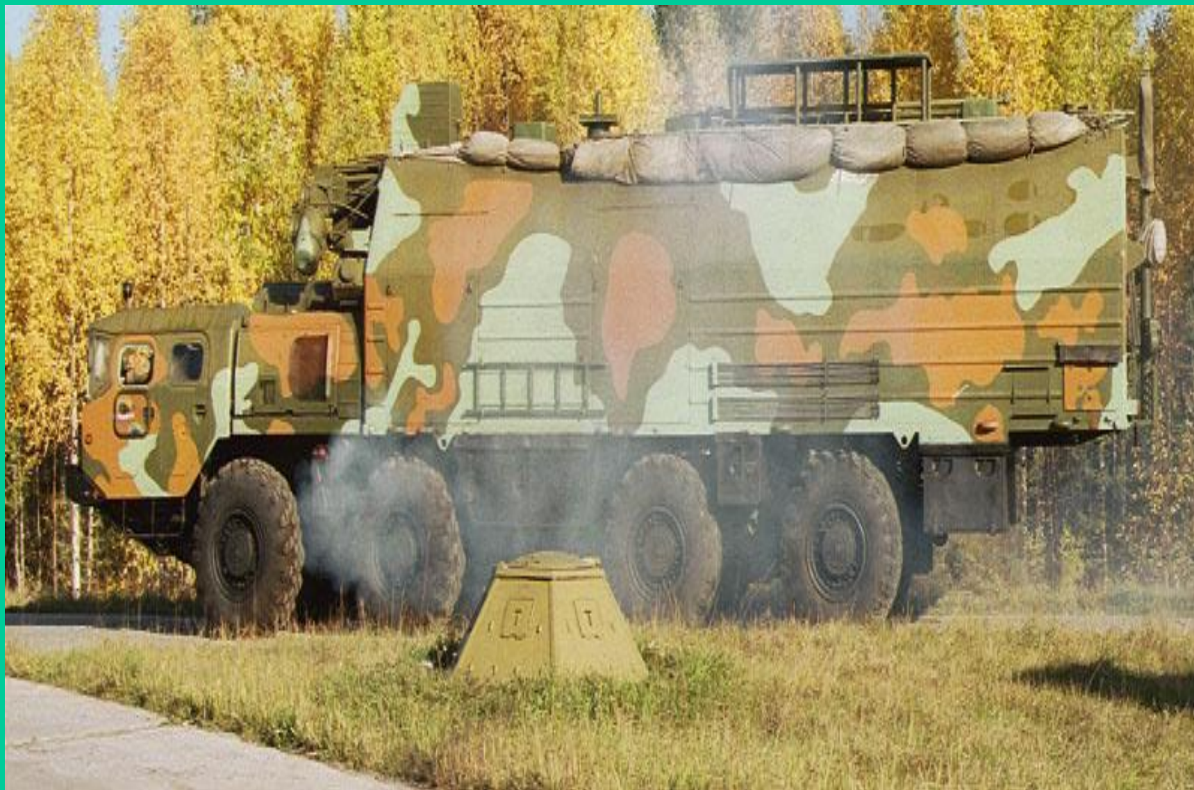
машина боевого управления ракетных войск