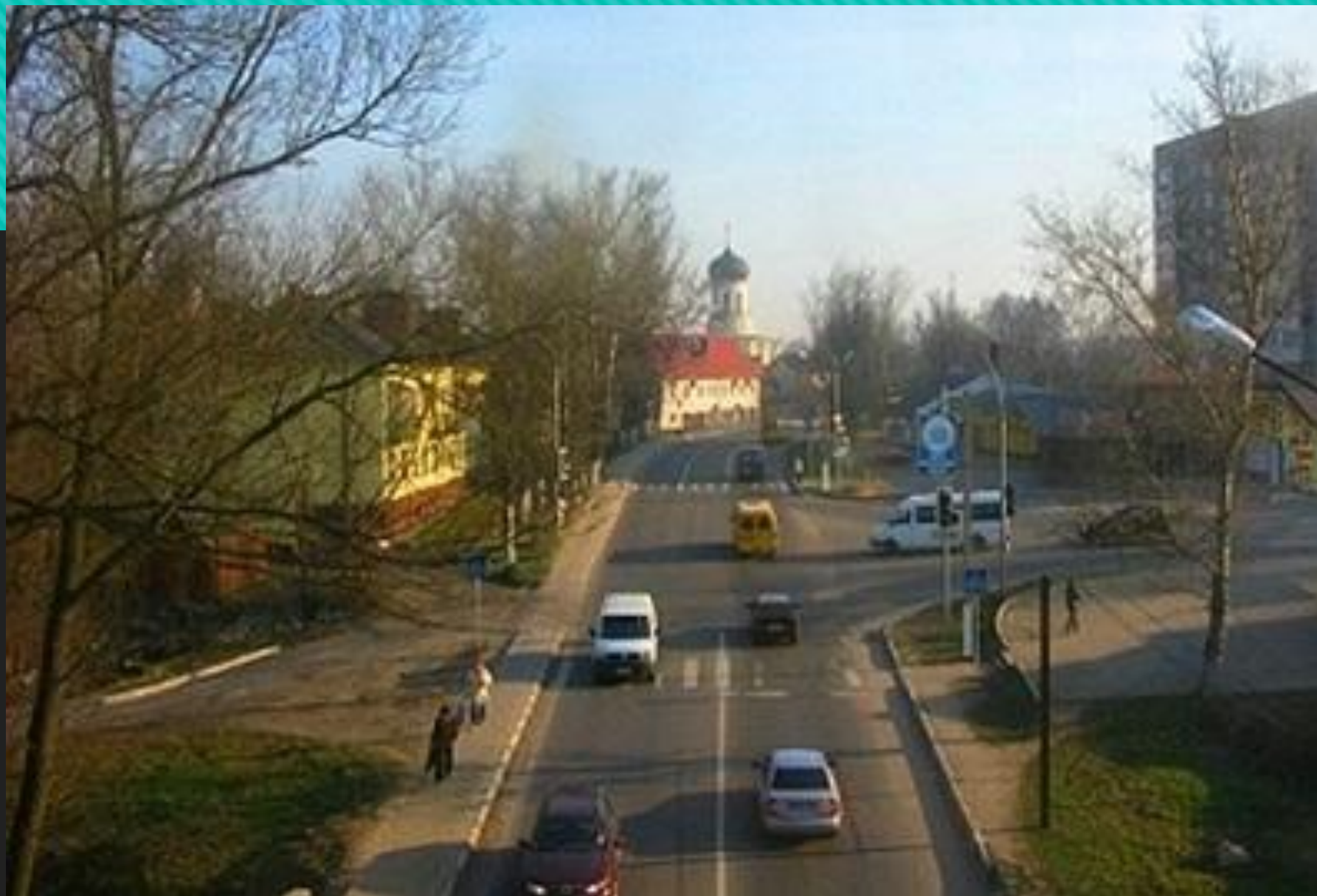
Въезд с улицы Московской