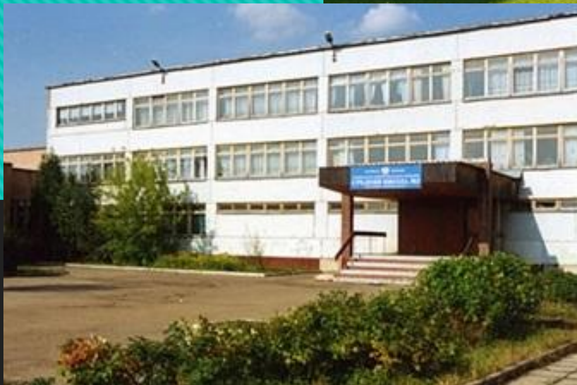
«Школа № 3»