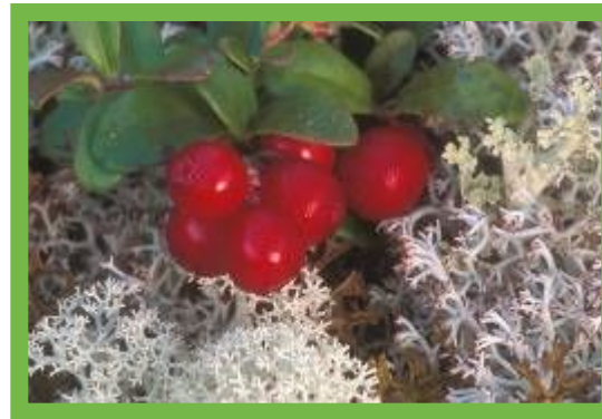
Ягель и брусника