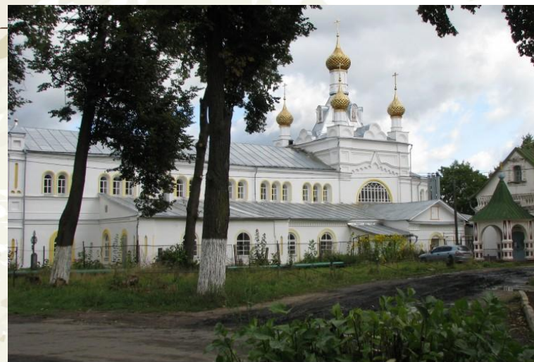
Храмовый комплекс с престолами Ильи Пророка и Николая Чудотворца. Возведен между 1694 и 1795 гг.

Церковный ансамбль - это духовный центр нашего города