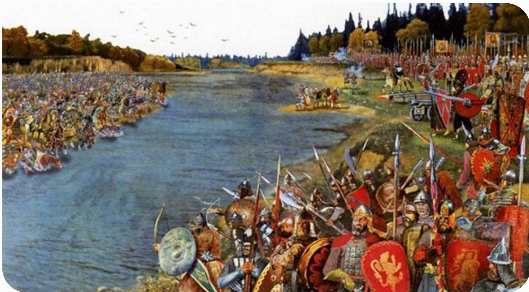
Стояние на реке Угре