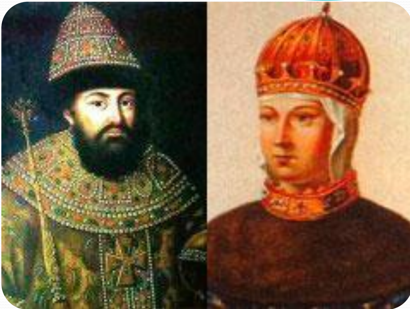
Иван III и Софья Палеолог