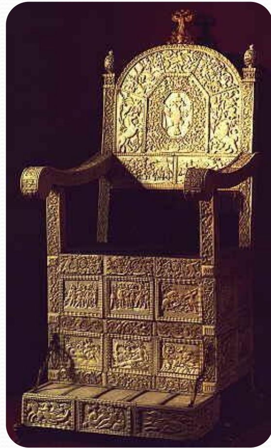
Трон Ивана III