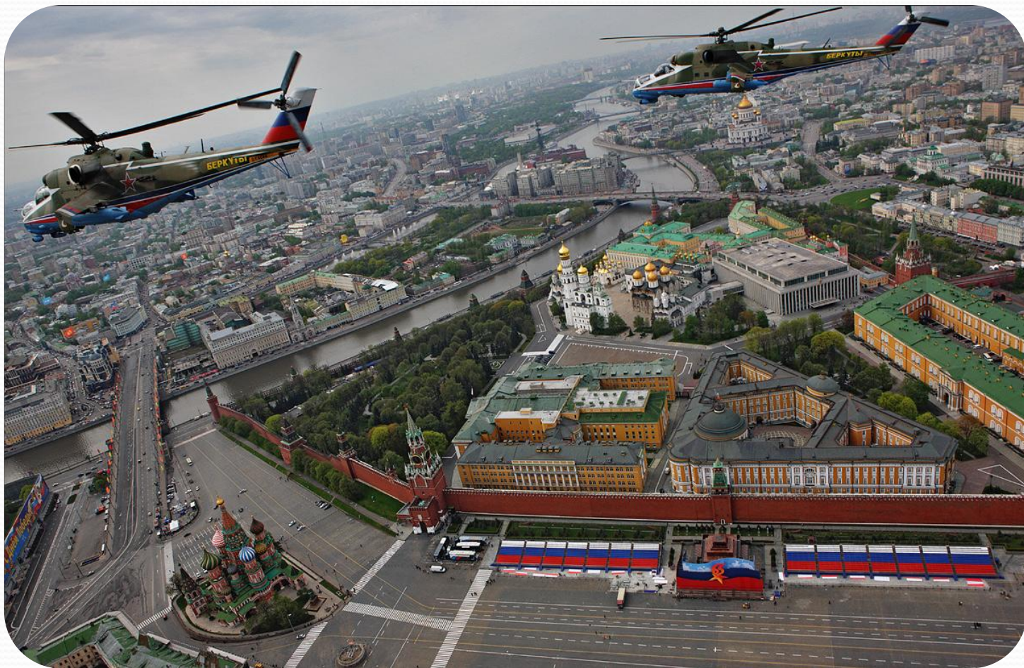
Кремль с высоты птичьего полета