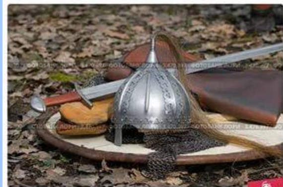
Шлем и меч на щите