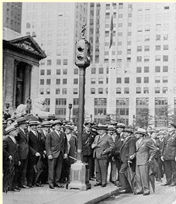
Первый электрический светофор