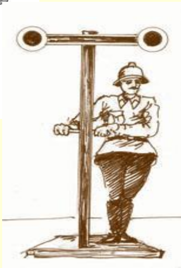
Первый уличный семафор