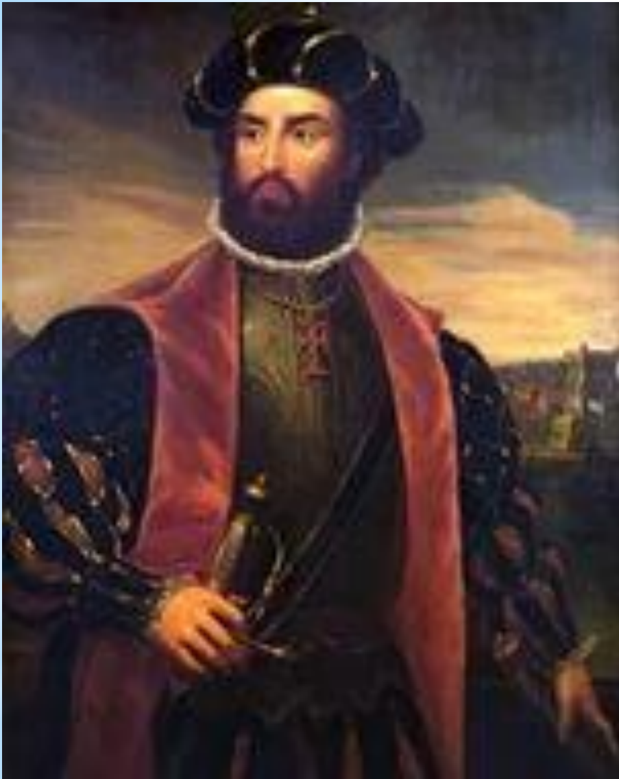
Васко Да Гама