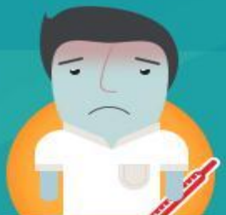
Повышенная температура тела