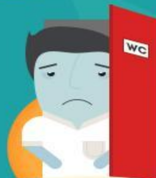
Сильные боли в животе с диареей до 10-15 раз в сутки