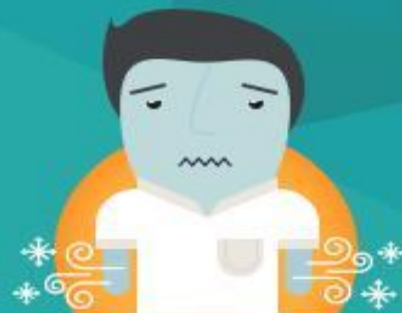
Руки и ноги холодеют