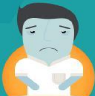
Воспаления желудка и тонкого кишечника (острый гастроэнтерит)