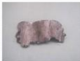
бурые и каменные