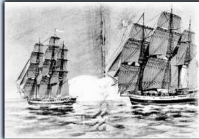
Шлюпы Восток и Мирный

Антарктида была открыта последней из материков Земли. Существование Южного материка предполагалось очень давно, на старинных картах его часто объединяли с Южной Америкой или с Австралией, получившей название в честь этой гипотетической части суши. И только экспедиция Беллинсгаузена и Лазарева в южно-полярных морях на шлюпах «Восток» и «Мирный» подтвердила факт наличия шестого материка Земли. Это случилось 16 (28) января 1820 года (официальная дата открытия Антарктиды) в районе современного шельфового ледника Беллинсгаузена.