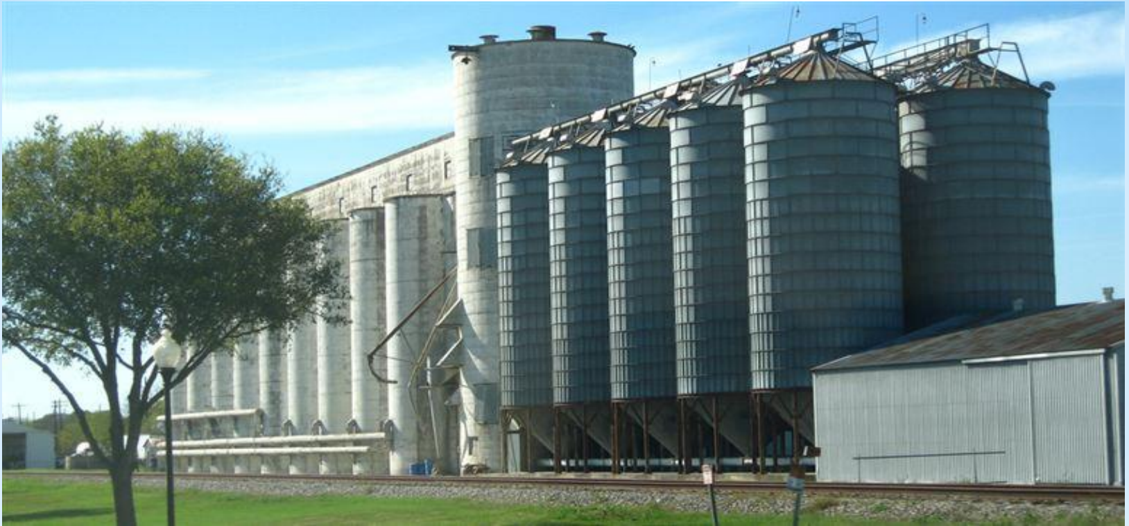
Современное хранилище для зерна - элеватор .