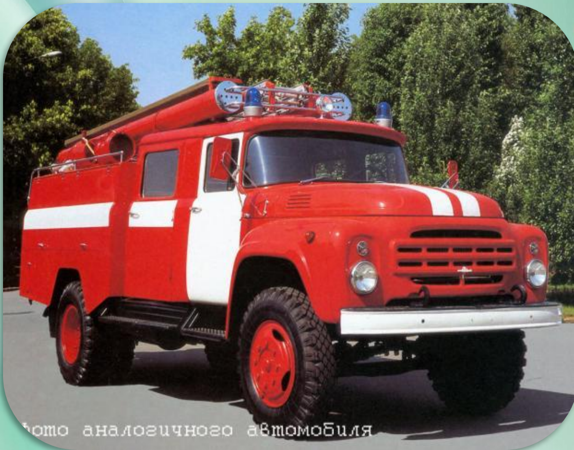
фото аналогичного автомобиля

Машина пожарная- красного цвета. А ну-ка, подумай, зачем нужно это? Затем, чтобы каждый, увидев, бежал В сторонку и ехать бы ей не мешал.