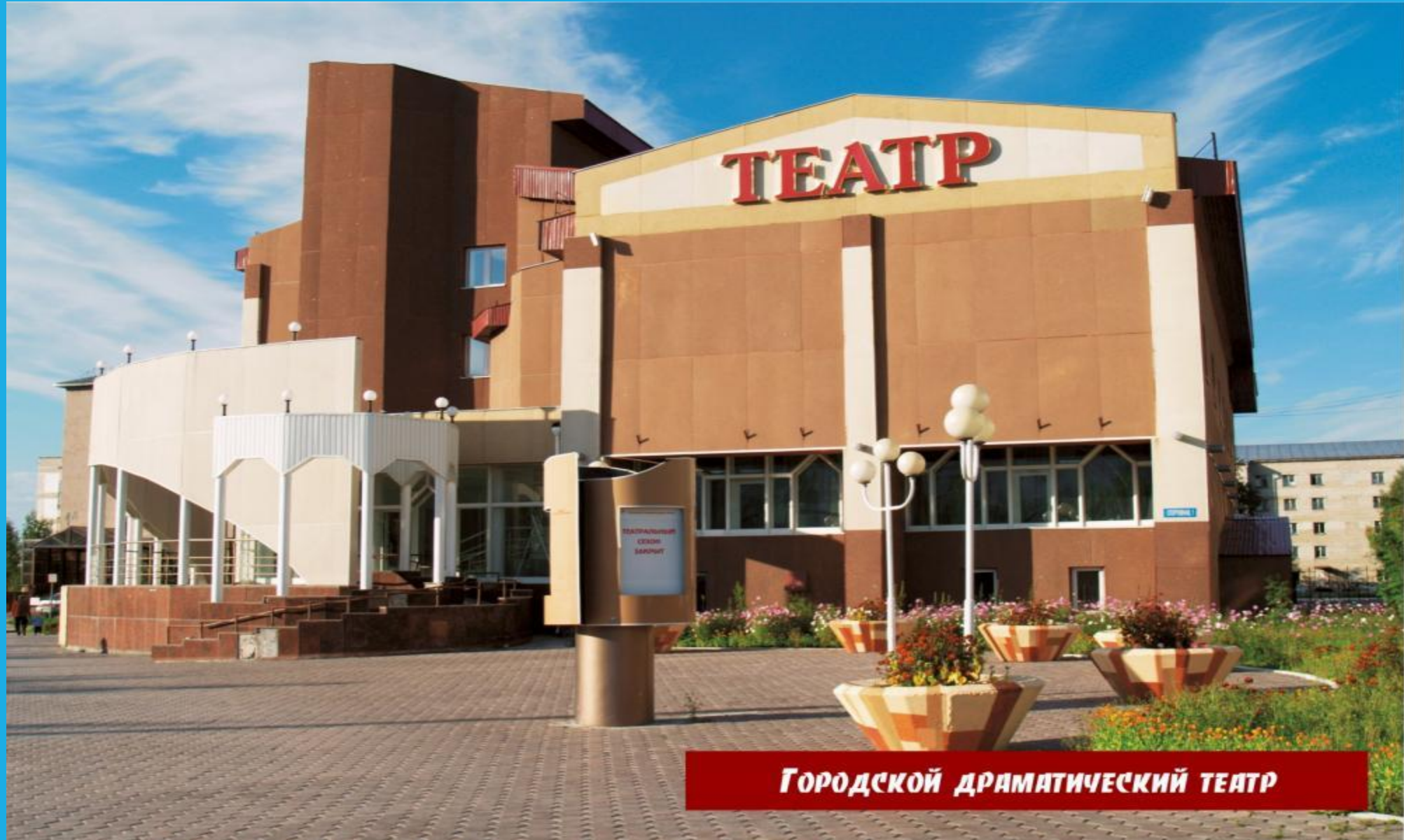
Городской драматический театр