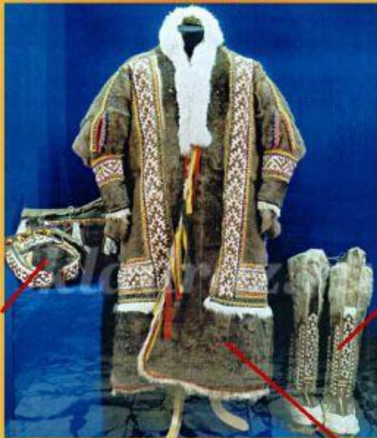
ПИМЫ, ЛИПТЫ - обувь