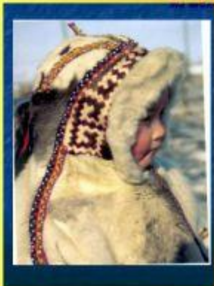
ТОБУРКИ - головные уборы