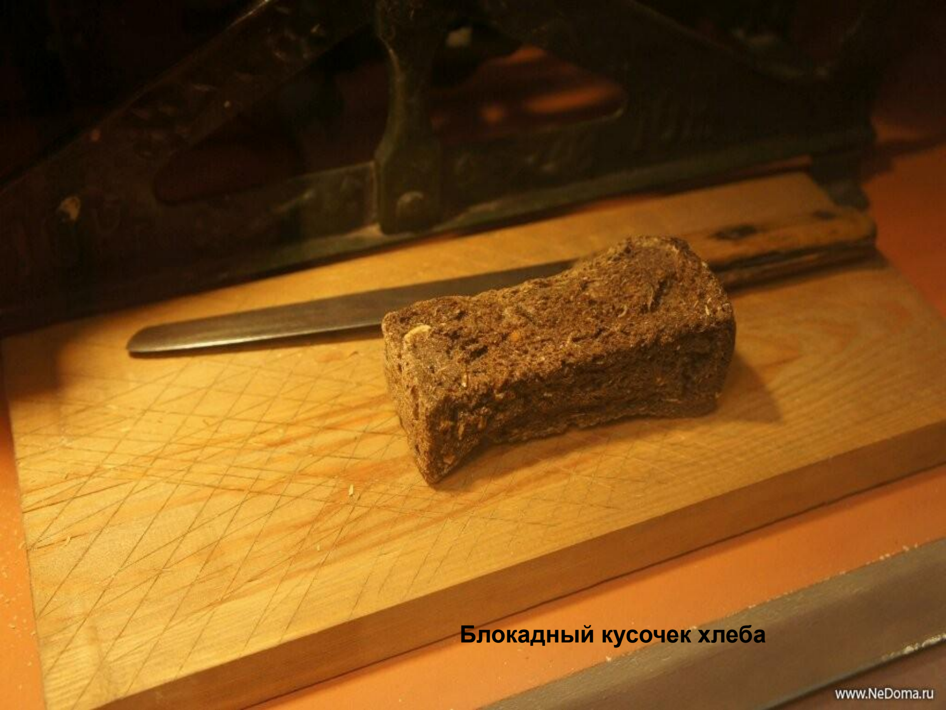
Блокадный кусочек хлеба