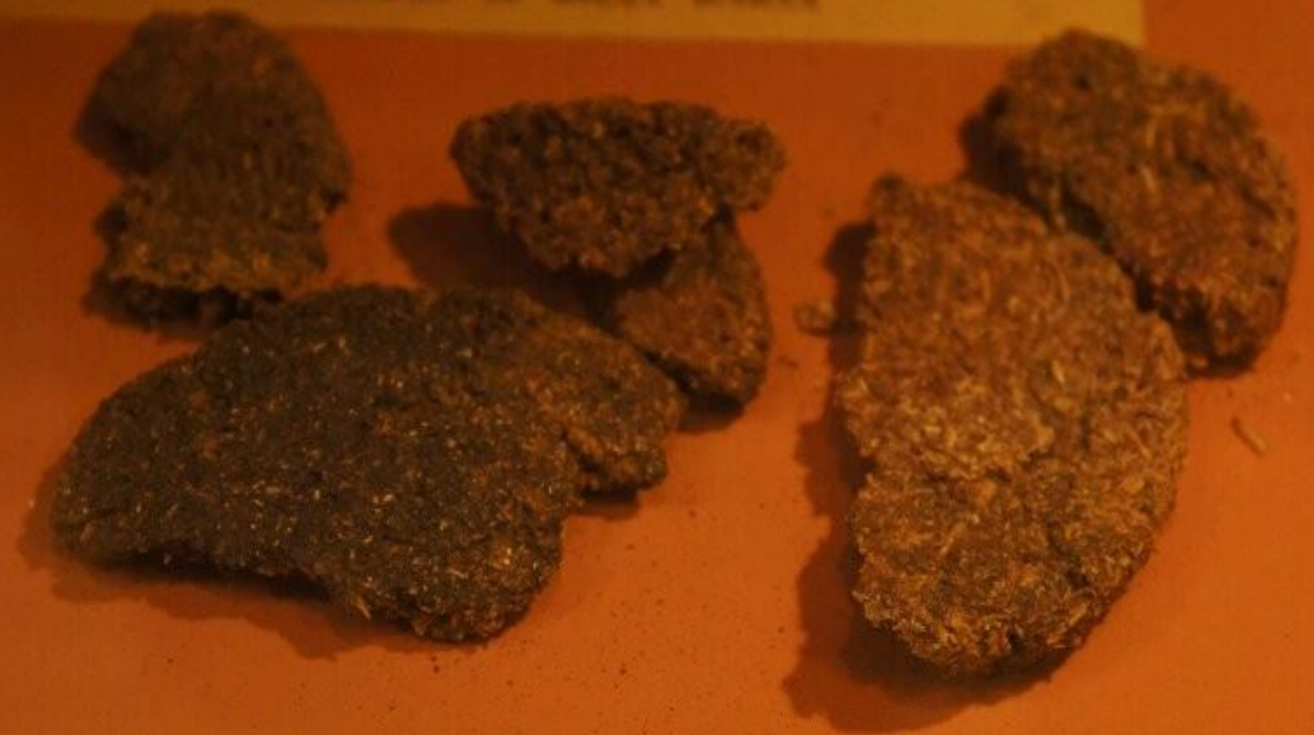
ЛЕПЕШКИ ИЗ ЛЕБЕДЫ С ОТРУБЯМИ, ПОДЖАРЕННЫЕ НА МАШИННОМ МАСЛЕ