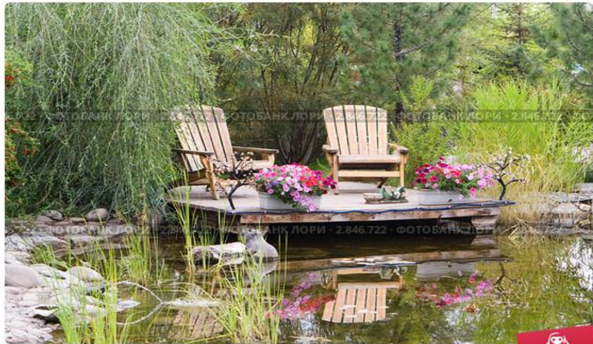
Абакан. Ландшафтный парк "Сады мечты". Место отдыха у пруда