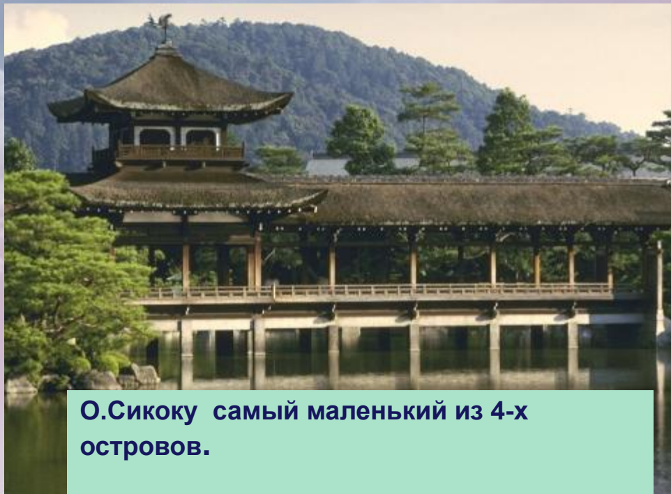
О.Сикоку самый маленький из 4-х островов.