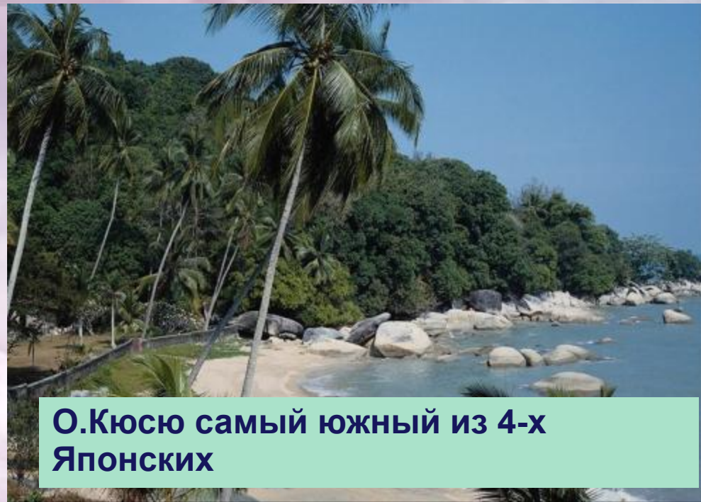
О.Кюсю самый южный из 4-х Японских