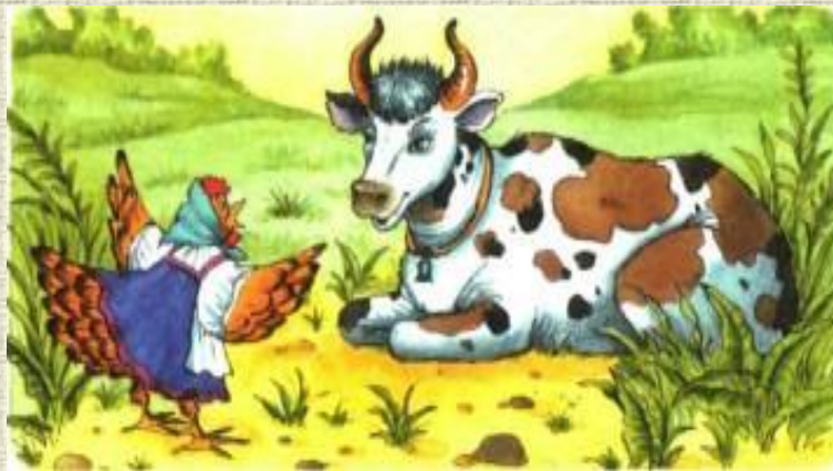
Петушок и бобовое зернышко