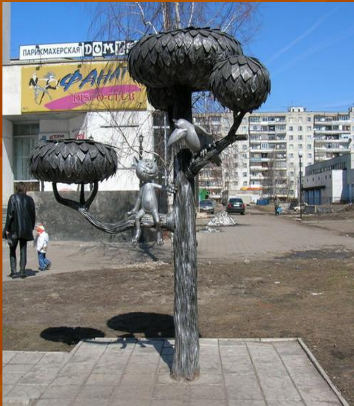
Котенок с улицы Лизюково г. Воронеж