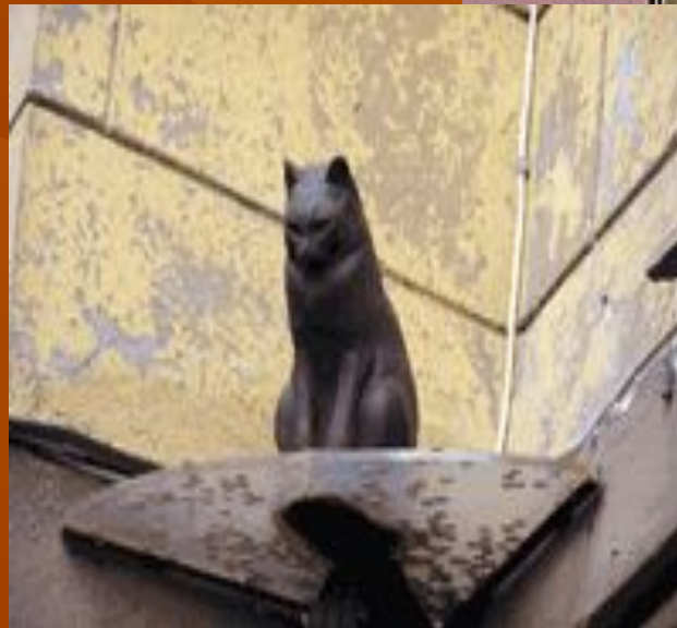
Кот Елисей и кошка Василиса г. Санкт - Петербург