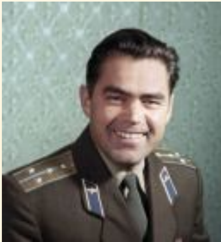
1951 ҫулта Фрунзери ҫар авиаци летчикёсен училищинче вёренме пуҫланă

... Андриян летчика вёренет, Хайёнчен хай йалтах тёлёнет: Ҫутă ёмёт кёрет пурнăҫа — Аҫта хурăн чунри савнăҫа!