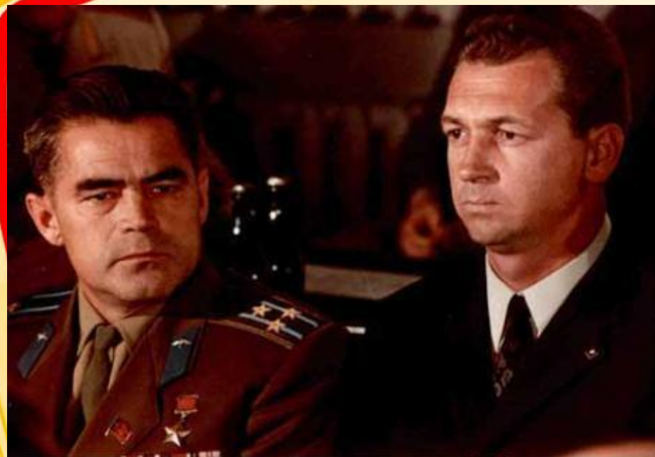
Николаевпа Севастьянов вёсєв хысқан

Вёсєвё 17 талак та 16 сехет те 58 минут та 55 секунд пынă