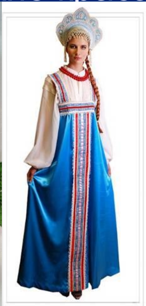
“РУССКАЯ КРАСАВИЦА” Арт Н180137