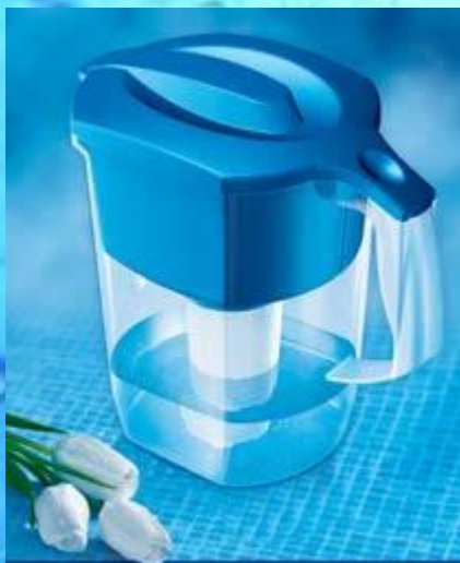
АКВАФОР КУВШИН РЕСУРС 300 ЛИТРОВ