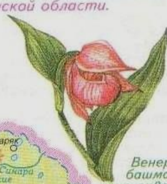
Венерин башмачок крупноцветковый