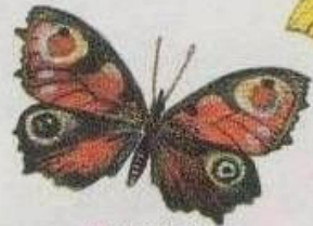
Дневной павлиний глаз