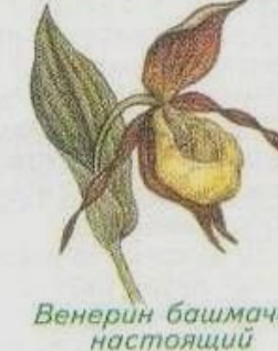
Венерин башмачок настоящий