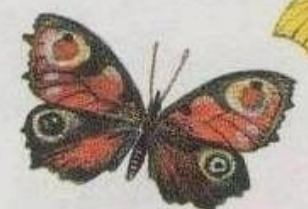
Дневной павлиний глаз