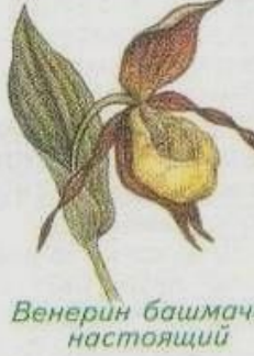
Венерин башмачок настоящий