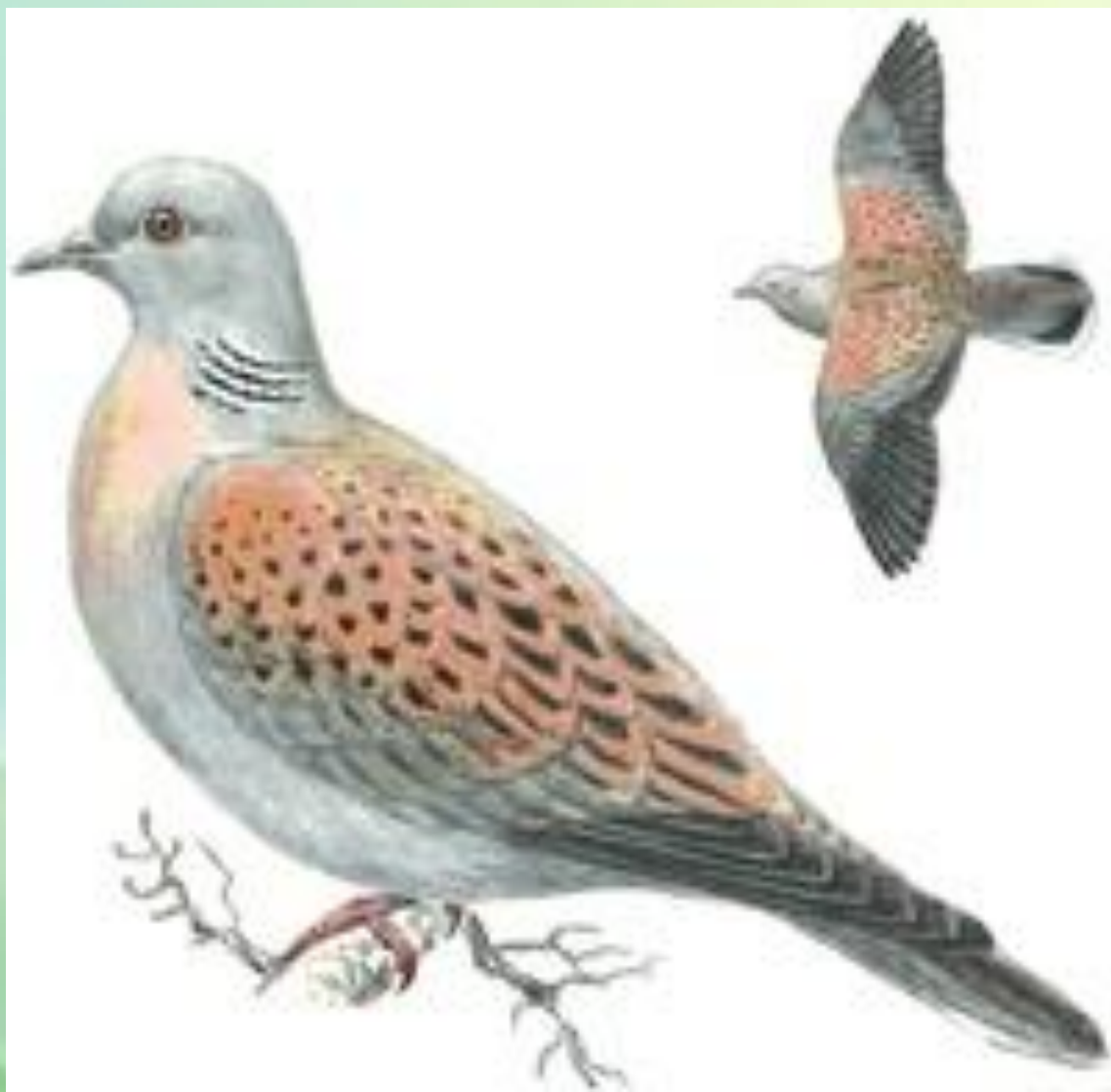
ГОРЛИЦА ОБЫКНОВЕННА Я