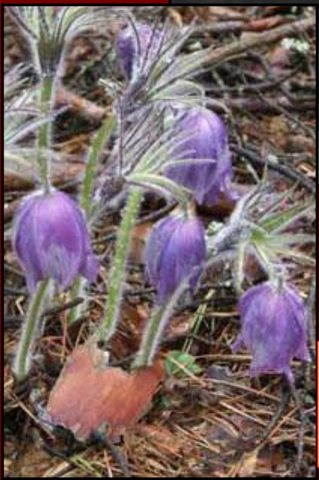
Сон –трава (прострел раскрытый)